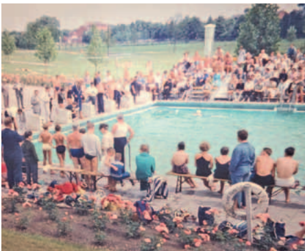
60er Jahre im Scherbsgraben-Bad: Ein Wettkampf vor einer damals noch existierenden Tribüne.

Bei den Jugendlichen gab es stets Erfolge bis auf Bayerische Ebene, die so-