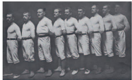
Die Geräteturner des Tuspo im Jahre 1912.