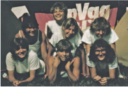
1983 gab es erstmals auch ein Volleyball-Frauenteam.

gen begannen 1989 mit einer Einladung beim Deutschen Turnverein von Mailand zu einem Volleyballturnier.