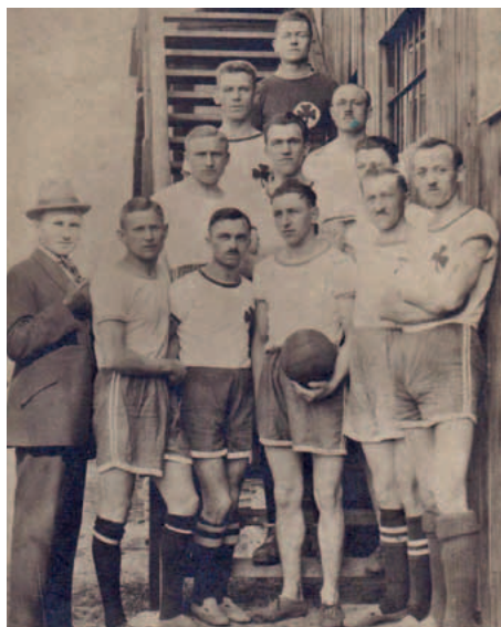
Das 1920 formierte Handballteam stellte sich am Hintereingang der Tribüne im Ronhof zum Foto auf.

Die Geschichte des Handballs beim Kleeblatt muss in drei Abschnitte gegliedert werden. 1920 etablierte sich eine Abteilung, die 1975 eine Spielgemeinschaft mit dem TV 1860 einging. Nachdem diese 1995 aufgekündigt wurde und die Handballer beim TV verblieben waren, gab es seit der Verschmelzung mit dem TUSPO 2003 wieder eine Frauenmannschaft.