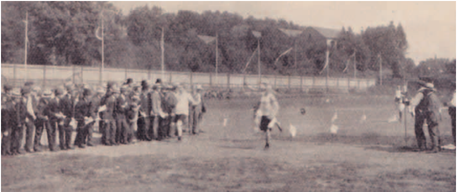
1907 an der Vacher Straße: Zieleinlauf eines Laufwettbewerbs.