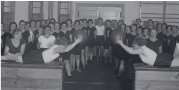
Die Turnerinnen des Tuspo auf einem Foto aus dem Jahre 1930.

Die Turnabteilung blickt auf eine längere Historie als das Kleeblatt selbst zurück, denn die Wurzeln gehen auf den Arbeiter-Turnverein (später TSV Fürth / Tuspo Fürth) zurück, der 1895 gegründet worden war. Gründungsmitglieder waren unter anderem die Sozialdemokraten Hans Vogel und Hans Böckler. Vogel war später von 1931-1933 Vorsitzender der SPD und von 1933-1945 Vorsitzender der SPD im Exil. Böckler war erster Vorsitzender des Deutschen Gewerkschaftsbundes.