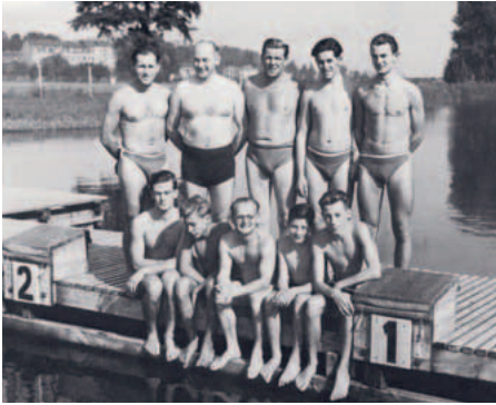
1950 wurden die Schwimmer der Spielvereinigung Stadtmeister im „Sportbad am Waldmannsweiher“.

Am 8. August 1920 trafen sich rund 50 Frauen, Männer und Jugendliche am damaligen Fürther Kanalhafen an der Poppenreuther Straße, um unter der Leitung von Gottlieb Wunschel eine Schwimmabteilung aus der Taufe zu heben.